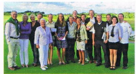
Preisträger beim Preis der Clubgastronomie.

Einen großen Wermutstropfen allerdings gab es an diesem Abend. Unsere Diana Hardy ver-