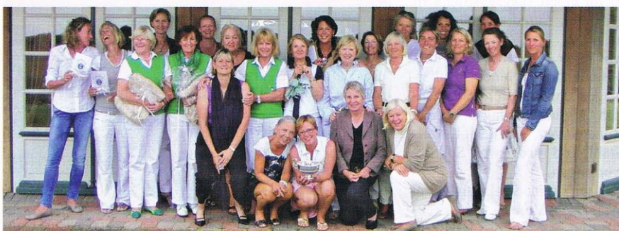
Strahlende „Weiblichkeit“ bei dem Preis der Lachmöwen.